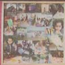
De School in Zandvoort