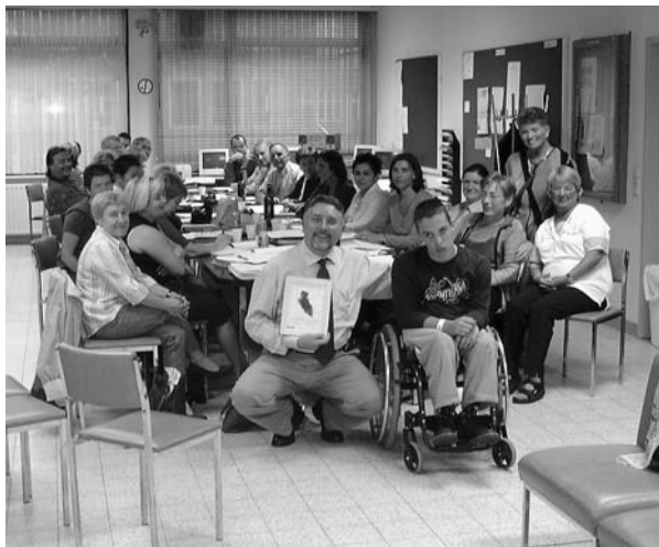
Jaarlijks wordt door GRIP, een organisatieplatform dat ijvert voor Gelijke Rechten voor Iedere Persoon met een handicap in Vlaanderen, de inclusiepluim uitgereikt aan een school omwille van de inzet voor inclusie-onderwijs.